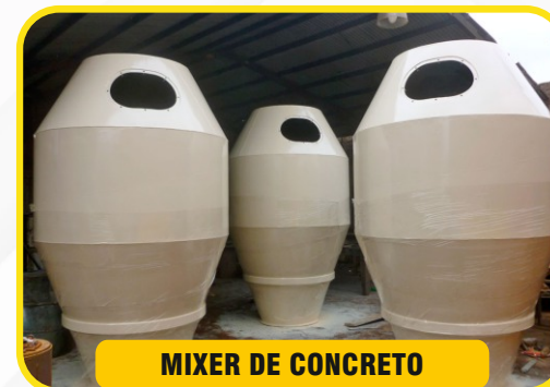
MIXER DE CONCRETO