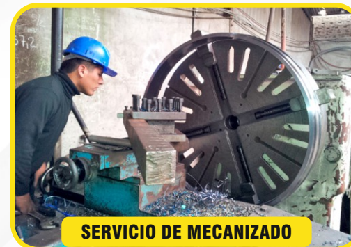
SERVICIO DE MECANIZADO