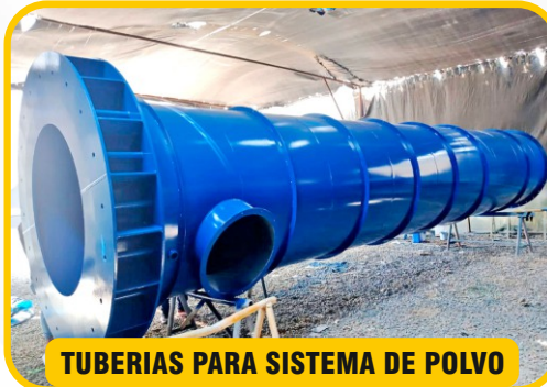
TUBERIAS PARA SISTEMA DE POLVO