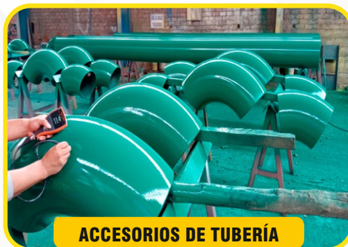
ACCESORIOS DE TUBERÍA