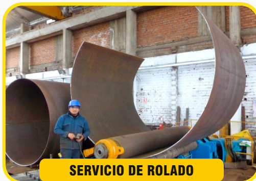
SERVICIO DE ROLADO