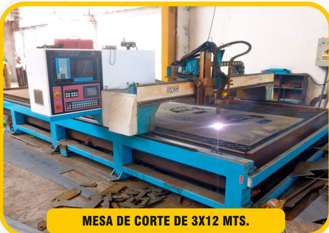
MESA DE CORTE DE 3X12 MTS.