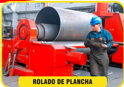
ROLADO DE PLANCHA