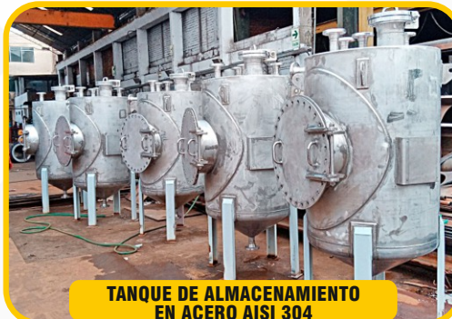
TANQUE DE ALMACENAMIENTO EN ACERO AISI 304