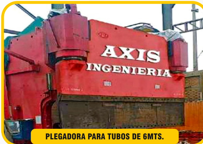
PLEGADORA PARA TUBOS DE 6MTS.