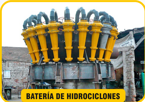
BATERÍA DE HIDROCICLONES