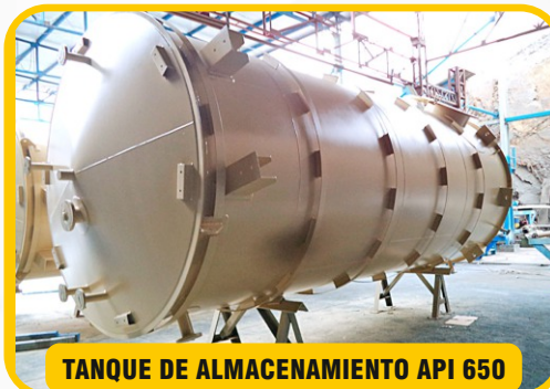
TANQUE DE ALMACENAMIENTO API 650