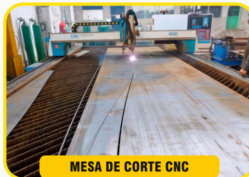
MESA DE CORTE CNC