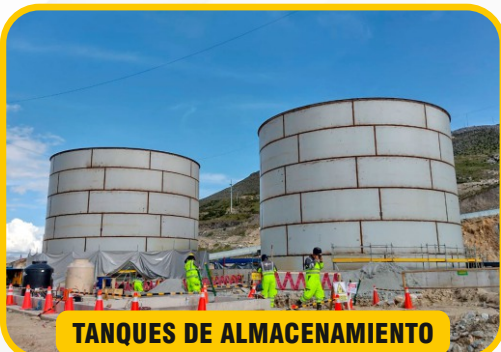
TANQUES DE ALMACENAMIENTO