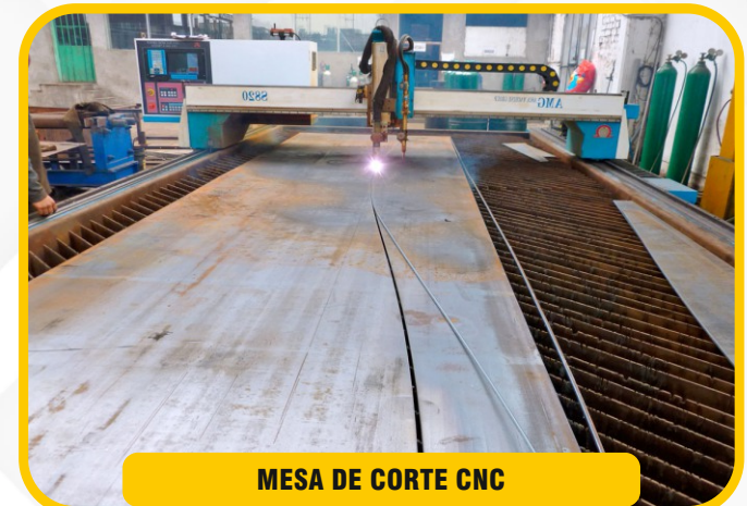
MESA DE CORTE CNC