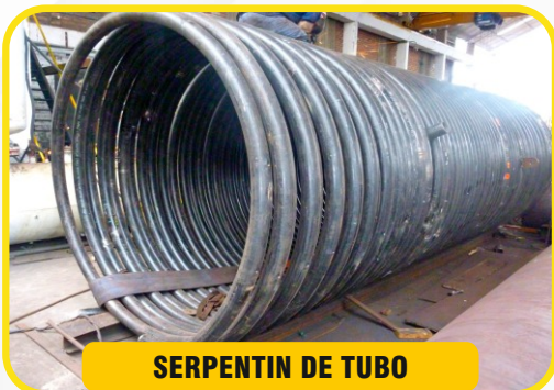
SERPENTIN DE TUBO