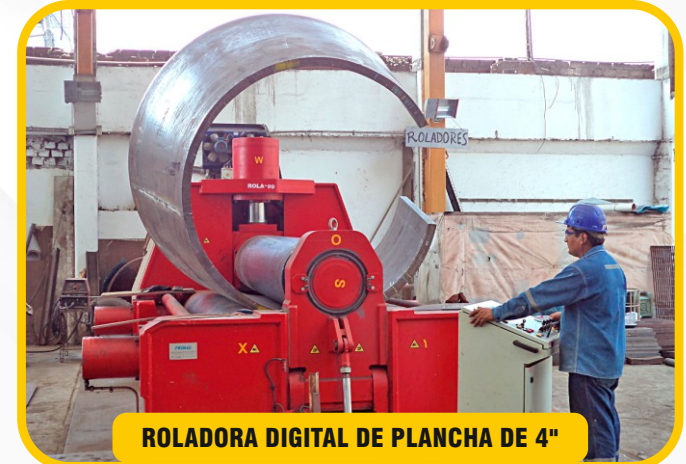
ROLADORA DIGITAL DE PLANCHA DE 4"