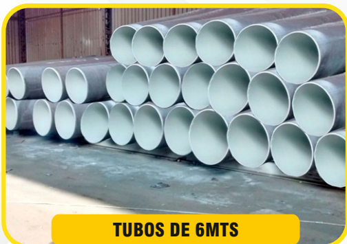
TUBOS DE 6MTS