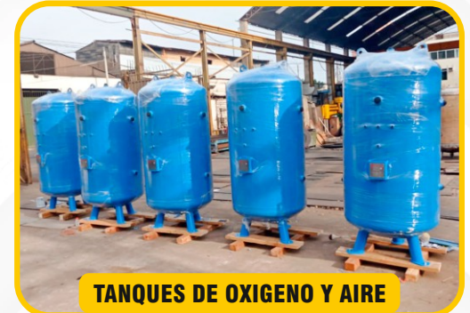
TANQUES DE OXIGENO Y AIRE