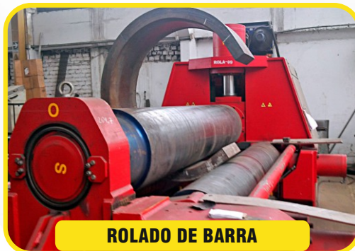
ROLADO DE BARRA