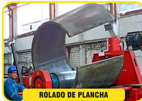
ROLADO DE PLANCHA